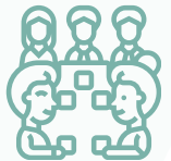
Table de presse sur place

Venez boire un verre et partager un moment convivial !